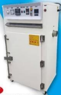
大型熱風循環烘箱 Air Conditioning Blower for Technicians