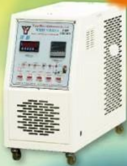
WMTC-2001雙溫度水(油)循環式模溫機 Dual-Temperature Type Water(Oil) Temperature Controller