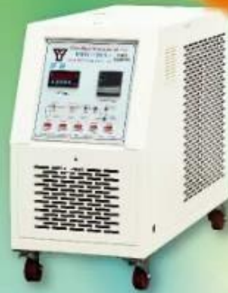
WMTC-2001水循環式模溫機 Water Cycle Temperature Controller