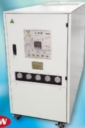
W(1~30)RT 水冷式冷凍機 Chiller