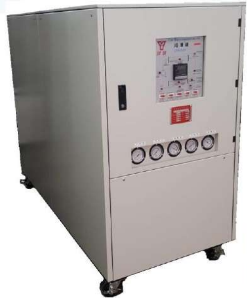
水冷式冷凍機配備規格表(30RT以上可接受訂製)