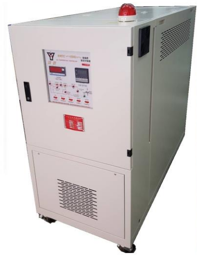
OMTC-2001系列油溫機規格表(特殊規格可接受訂製)