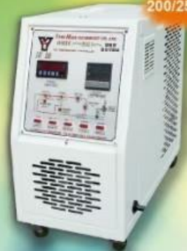
OMTC-2001油循環式模溫機 Oil Cycle Temperature Controller