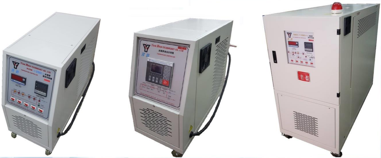
WMTC-2001系列水溫機規格表(特殊規格可接受訂製)