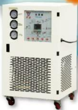
冷熱兩用模溫冷凍機 Cold/Heat Dual Purposed Chiller