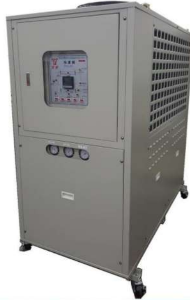
氣冷式冷凍機配備規格表(30RT以上可接受訂製)