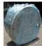
SF 包裝後儲存, 外銷