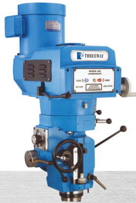
EZ-198 · EZ-5 VARIABLE SPEED 無段變速 5HP