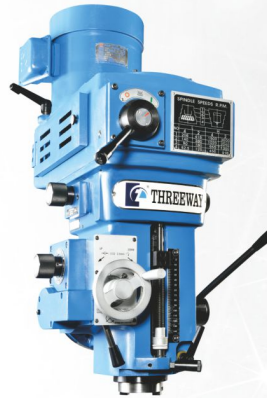
EZ-200 STEP.SPEED 16段變速 5HP