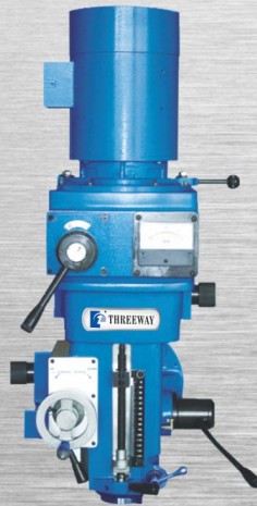
EZ-200 INVERTER.VARI SPEED 變頻無段 5HP