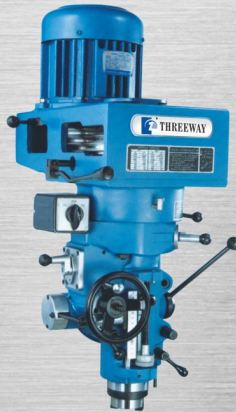
EZ-168 · EZ-3 · EZ-4 FORCEFUL HEAD 強力頭 3HP