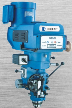
EZ-168 · EZ-3 · EZ-4 VARIABLE SPEED 無段變速 3HP