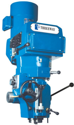
EZ-198 · EZ-5 INVERTER.VARI SPEED 變頻無段 5HP