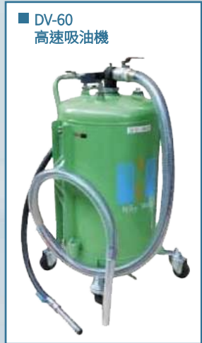
■ DV-60 高速吸油機