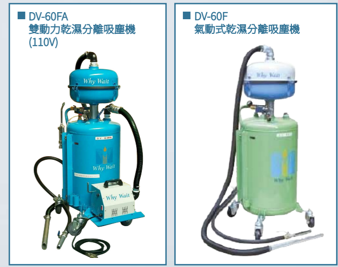
■ DV-60FA 雙動力乾濕分離吸塵機 (110V)