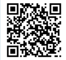
DV-60FA 雙動力乾濕分離吸塵機(110V)